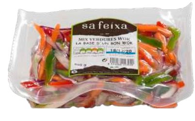
Mix verduras wok Bolsa al vacio