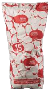
Patata roja lavada calidad especial Saco de papel de 15kg.