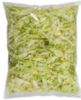
Lechuga iceberg juliana Bolsa 1kg.