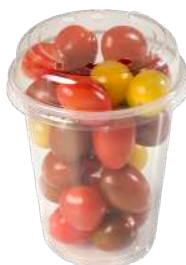
Tomate cocktail Vaso