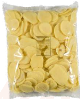
Patata panadera Bolsa de 3kg.