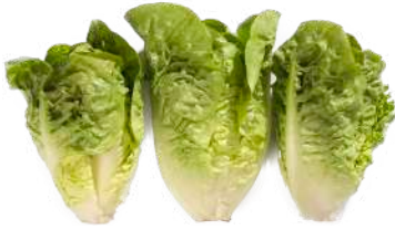
Cogollos de lechuga Bandeja flow pack

Frutas, verduras y hortalizas en bandeja