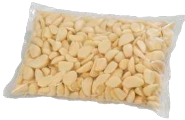
Ajo pelado Bolsa plástica 1 kg.