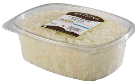
Cebolla picada Bandeja con tapa