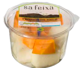
Melón trozos Vaso transparente