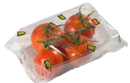
Tomate rama Bandeja flow pack