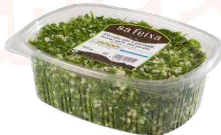
Picada ajo y perejil Bandeja con tapa