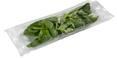
Albahaca Bandeja flow pack