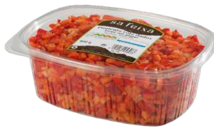
Pimiento rojo dados Bandeja con tapa