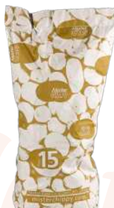
Patata blanca lavada calidad especial Saco de papel de 15kg.