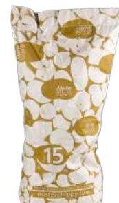
Patata especial para frito variedad agria Saco de papel de 15kg.