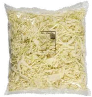
Col blanca juliana Bolsa 1kg.