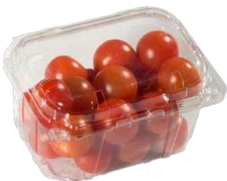
Tomate cherry Bandeja flow pack