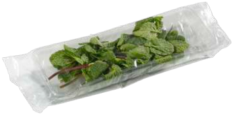
Hierbabuena Bandeja flow pack