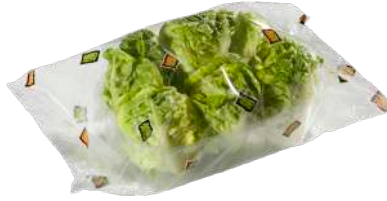
Corazones de lechuga Bandeja flow pack