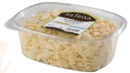
Ajo laminado Bandeja con tapa