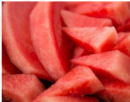
Sandía cubos Bandeja 2 kg.