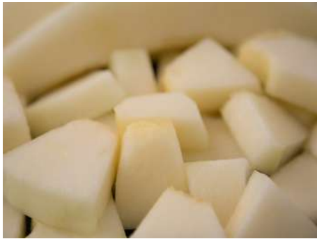
Melón cubos Bandeja 2 kg.