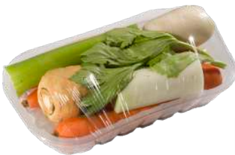
Mezcla de verduras Bandeja film extensible