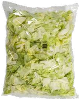
Lechuga iceberg corte Bolsa 1kg.