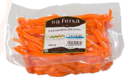
Zanahoria juliana Bolsa al vacio