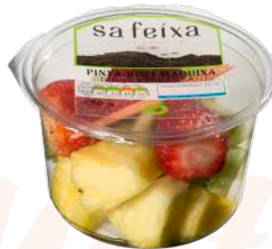
Piña, kiwi y fresas Vaso transparente