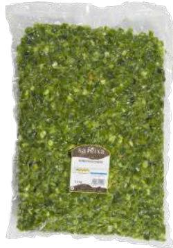
Pimiento verde dados Bolsa vacío 2 kg.