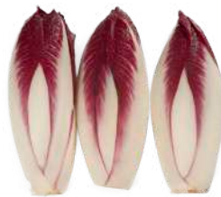
Endivias rojas Bandeja flow pack