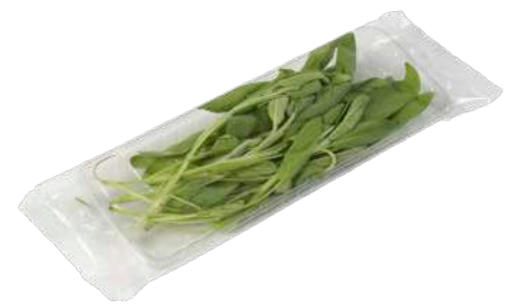
Salvia Bandeja flow pack