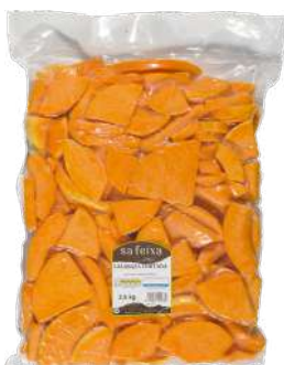
Calabaza fresca cortada Bolsa vacío 2kg.