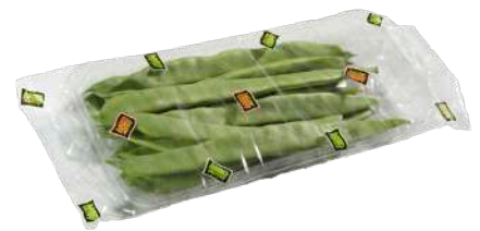
Judía plana Bandeja flow pack