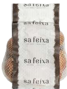
Cebolla seca bolsa 1kg. Bolsa de 1kg.