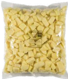
Patata dado Bolsa de 3kg.