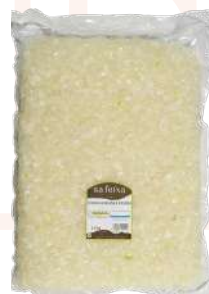
Cebolla picada Bolsa vacío 2kg.