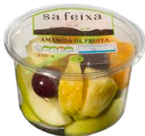
Ensalada de frutas Melón, manzana, naranja y uva Vaso transparente