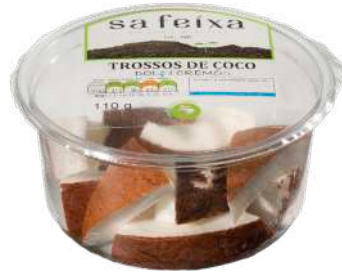
Trozos de coco Vaso transparente