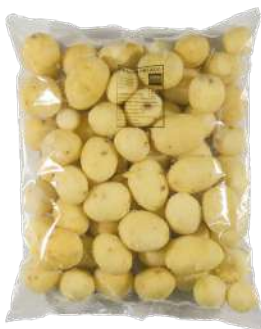
Patató pelado Bolsa de 3kg.