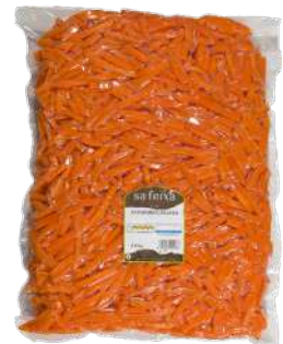
Zanahoria juliana Bolsa 2kg.