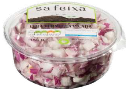
Cebolla roja picada Vaso transparente