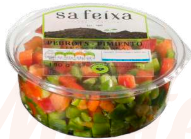
Pimiento verde y rojo en dados Vaso transparente