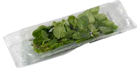
Menta Bandeja flow pack