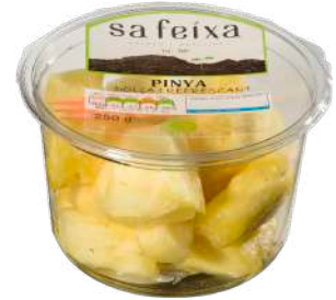
Piña trozos Vaso transparente