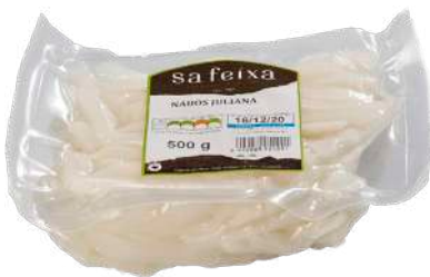
Nabos juliana Bolsa al vacio