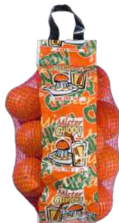
Naranja de mesa bolsa 3kg. Bolsa de 3kg.