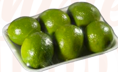
Limas Bandeja film extensible