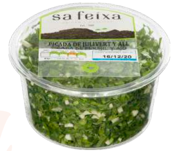
Picada ajo y perejil Vaso transparente