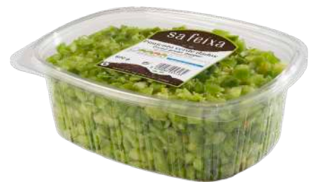
Pimiento verde dados Bandeja con tapa