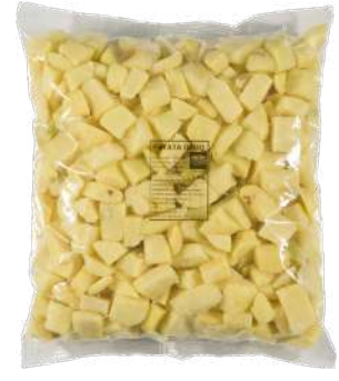
Patata brava freir Bolsa de 3kg.