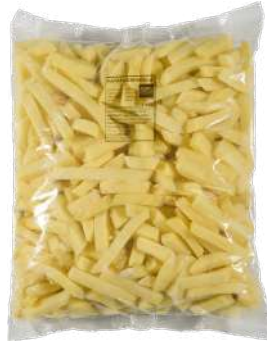
Patata española freir Bolsa de 3kg.