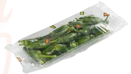
Pimientos de Padrón bandeja flow pack