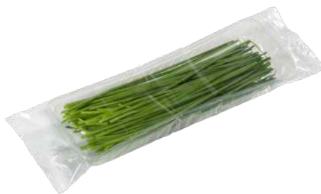
Cebollino Bandeja flow pack