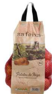
Patata roja ibicenca bolsa 2kg. Bolsa de 2kg.