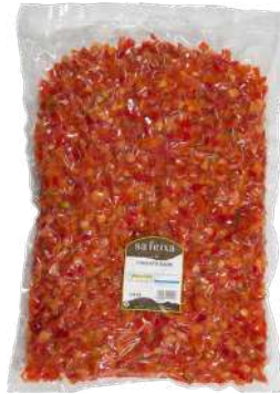
Pimiento rojo dados Bolsa vacío 2 kg.