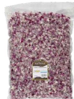
Cebolla roja picada Bolsa vacío 2kg.