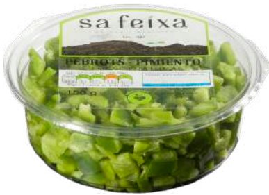
Pimiento verde en dados Vaso transparente