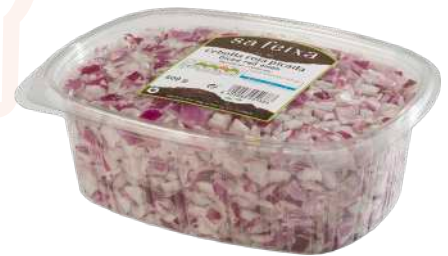
Cebolla roja picada Bandeja con tapa