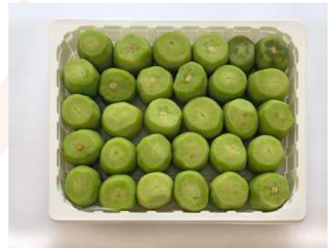
Kiwi entero pelado Bandeja 2 kg.