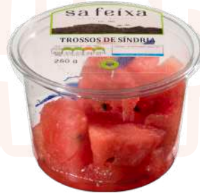
Sandía trozos Vaso transparente