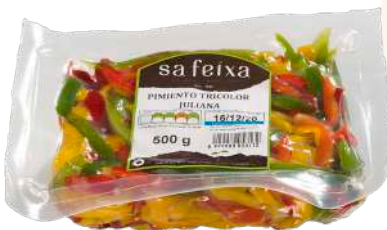
Pimiento tricolor juliana Bolsa al vacio