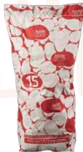
Patata roja ibicenca calidad especial Saco de papel de 15kg.