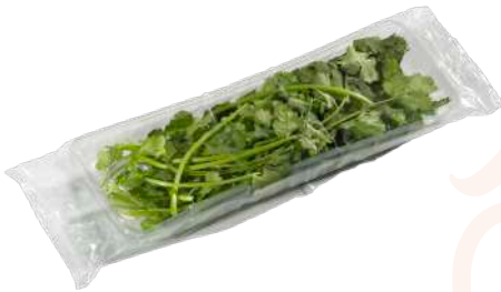
Cilantro Bandeja flow pack