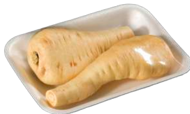
Chirivia Bandeja film extensible