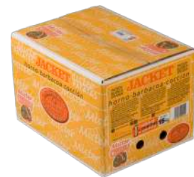
Patata blanca Jacket 65+ Caja de Carton de 15kg.