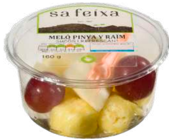
Melón, piña y uva Vaso transparente