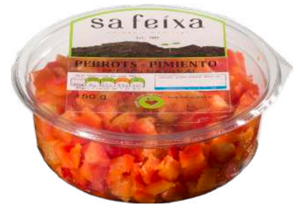
Pimiento rojo en dados Vaso transparente