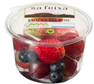
Exóticos del bosque Fresa, uva, arándanos y frambuesa Vaso transparente