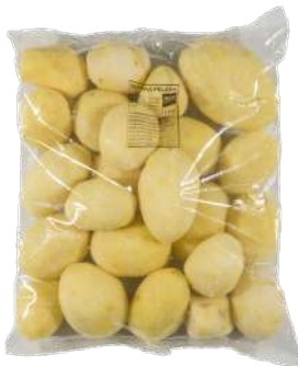
Patata entera pelada Bolsa de 3kg.