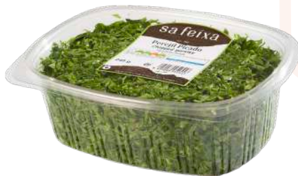
Perejil picado Bandeja con tapa