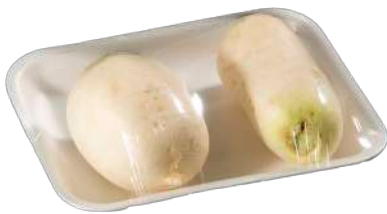
Nabos Bandeja film extensible