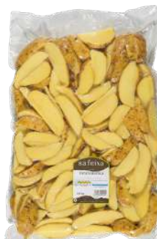
Patata rústica gajos Bolsa 3kg.