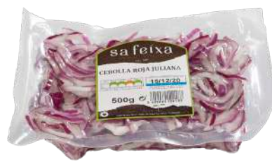
Cebolla roja juliana Bolsa al vacio