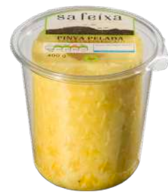
Piña cilindro Vaso transparente