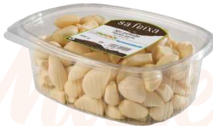
Ajo pelado Bandeja con tapa