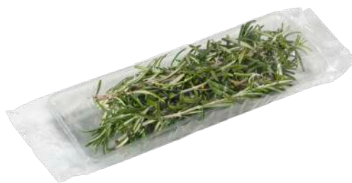
Romero Bandeja flow pack