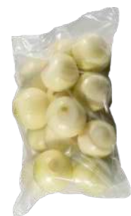
Cebolla blanca pelada Bolsa 5kg.