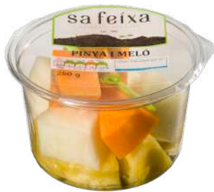
Cantaloupe, melón y piña Vaso transparente