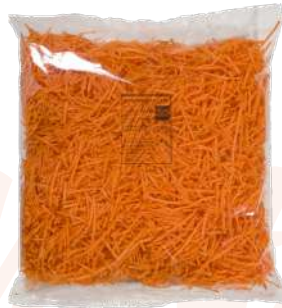
Zanahoria rayada Bolsa 1kg.