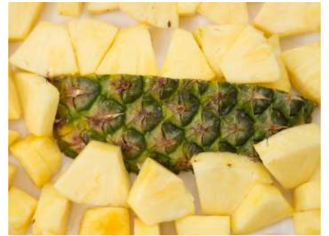
Piña cubos Bandeja 2 kg.