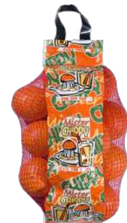
Naranja de zumo bolsa 2 y 5kg. Bolsas de 2 y 5kg.