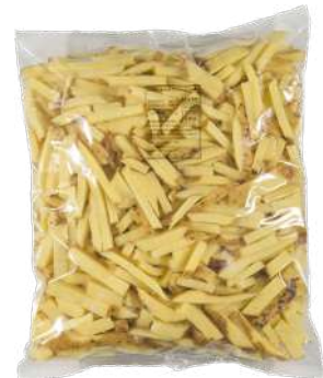
Patata rústica juliana Bolsa de 3kg.