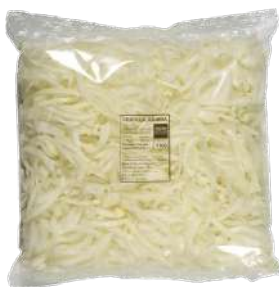
Cebolla juliana Bolsa 1kg.