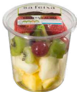
Selección de frutas 5 al día Melón, kiwi, piña, fresa y uva Vaso transparente