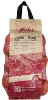
Patata freir bolsa 3kg. Bolsa de 3kg.