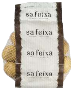
Patató lavado en bolsa 1kg. Bolsa de 1kg.