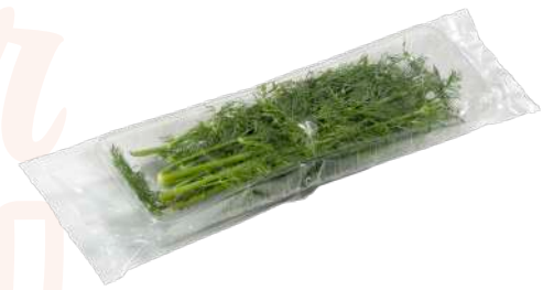
Eneldo Bandeja flow pack