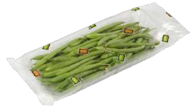
Judía redonda Bandeja flow pack