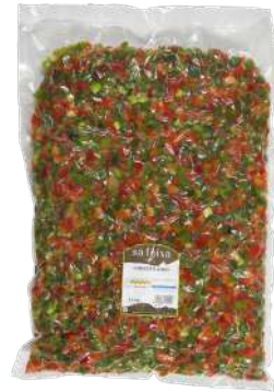
Pimiento verde y rojo dados Bolsa vacío 2 kg.