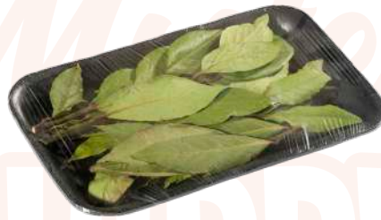
Laurel Bandeja film extensible