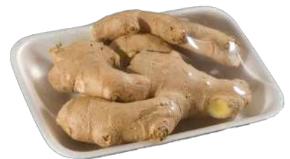
Jengibre Bandeja film extensible