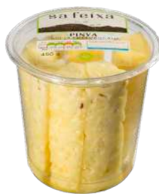
Piña gajos Vaso transparente