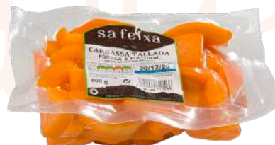
Calabaza cortada fresca Bolsa al vacio