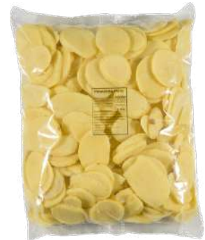
Patata panadera freir Bolsa de 3kg.