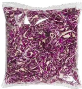
Col lombarda juliana Bolsa 1kg.