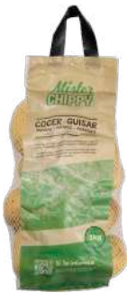
Patata hervir bolsa 3kg. Bolsa de 3kg.