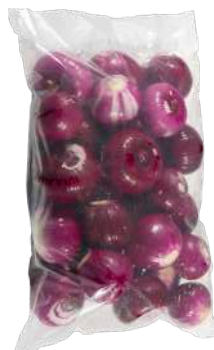
Cebolla roja pelada Bolsa 5 kg.