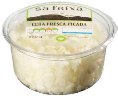
Cebolla blanca picada Vaso transparente

Hortalizas y verduras listas para consumir