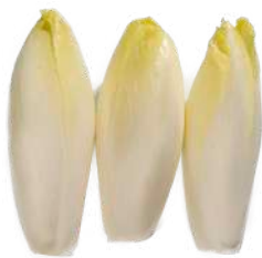
Endivias blancas Bandeja flow pack