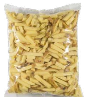
Patata rústica freir Bolsa 3kg.